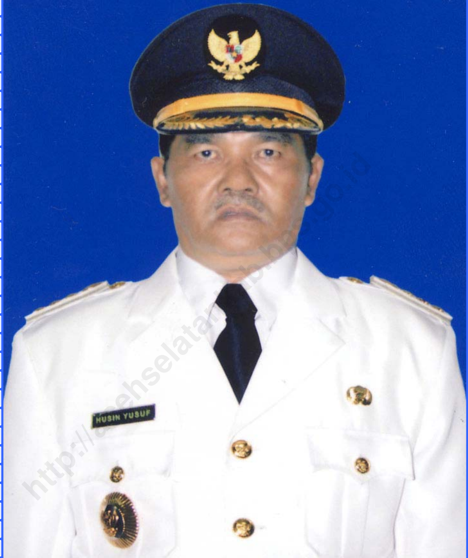
HUSIN YUSUF BUPATI ACEH SELATAN