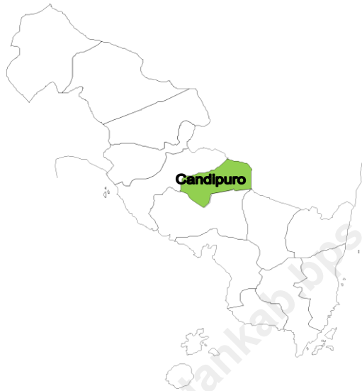
Tabel 1.1. Letak Kecamatan Candipuro menurut Batas Wilayah Tahun 2010