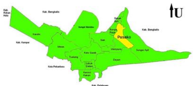
Peta Kecamatan Pusako

Kecamatan Pusako berjarak 54 km dari pusat pemerintahan kabupaten Siak. Pusako merupakan kecamatan dengan wilayah nomor enam paling luas diantara kecamatan se-kabupaten Siak, yakni sebesar 6,36% dari total wilayah Kabupaten Siak.