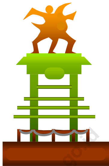
TUGU MAJULAH GENERASIKU