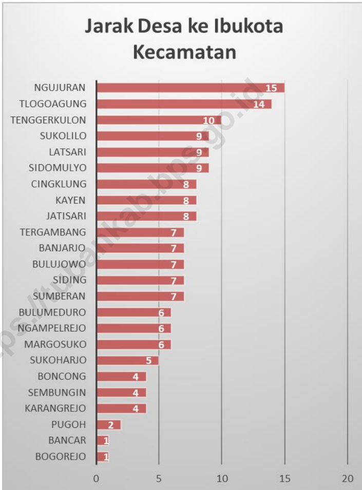
Jarak ke Ibukota Kecamatan Menurut Desa/Kelurahan di Kecamatan Bancar (km), 2021 Distance to the Subdistrict Capital by Village/Kelurahan in Bancar Subdistrict (km), 2021