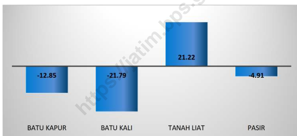
Gambar 2. Perubahan Harga Perdagangan Besar Komoditas Sektor Pertambangan Penggalian Tahun 2019-2020 (Persen)

Dari 4 (empat) komoditas sektor Pertambangan dan Penggalian yang diamati dalam penghitungan Indeks Harga Perdagangan Besar, satu komoditas mengalami kenaikan harga yaitu komoditas tanah liat sebesar 21,22 persen, sedangkan 3 komoditas lainnya mengalami penurunan. Komoditas Batu Kali mengalami penurunan tertinggi mencapai sebesar 21,79 persen sedangkan harga rata-rata komoditas Batu Kapur dan Pasir masing-masing mengalami penurunan sebesar 12,85 persen dan 4,91 persen.