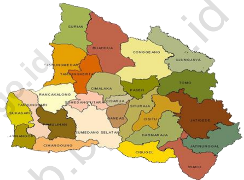
Gambar 1.1 Peta Kecamatan Darmaraja di Kabupaten Sumedang.

Dalam menjalankan roda pemerintahan desa, setiap desa dibantu oleh satu orang sekertaris desa, kepala seksi dan beberapa staf. Untuk mempermudah pelayanan terhadap masyarakat setiap desa dibagi menjadi beberapa Rukun Warga (RW) dan setiap RW terdiri beberapa Rukun Tetangga (RT).