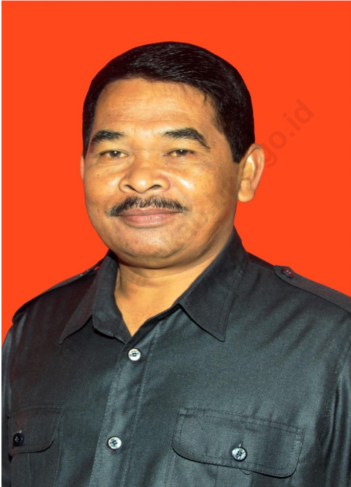
DONI BUKIT, SE